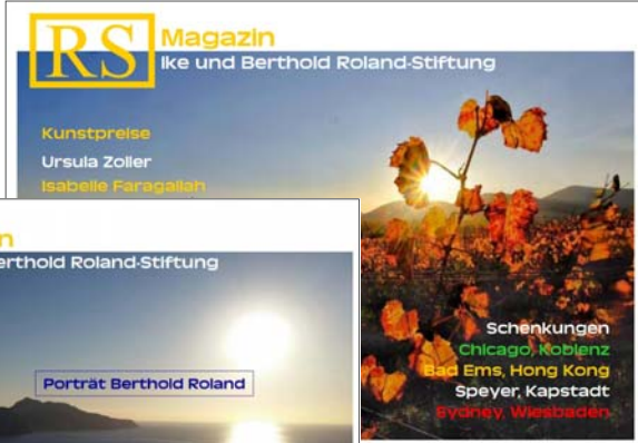
RS 6 135 Seiten /31 MB

RS 7 101 Seiten beide kostenlos per email.