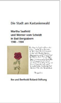
Heft, 28 Seiten, 4,90 €