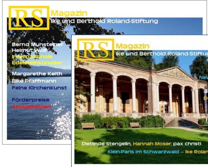
RS 4 300 Seiten /31 MB

RS 5 115 Seiten beide kostenlos per email.