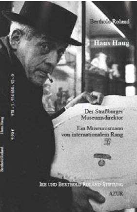
Buch, 60 Seiten, 9,90 €