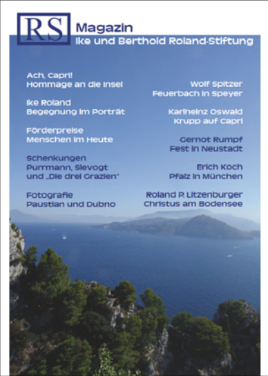
RS 1, 160 Seiten, 15 €