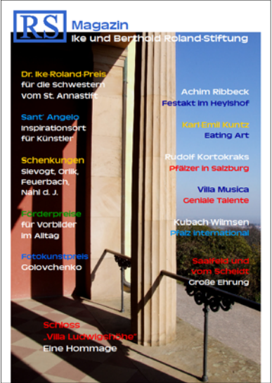
RS 2, 188 Seiten, 15 €