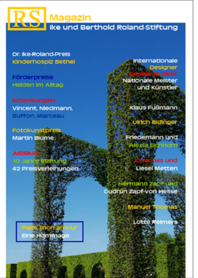
RS 3, 220 Seiten, 15 €