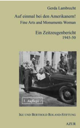
Buch, 50 Seiten, 7,90 €